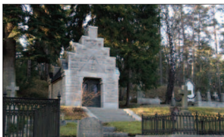
Nacka Gamla Kyrkogård (med Mausoleet ovan) ligger på skänkt Neumüllermark