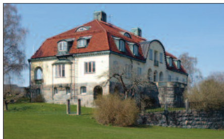
Hästhagen (eller 'Villa Neumüller' i Wikipedia) uppfördes 1906