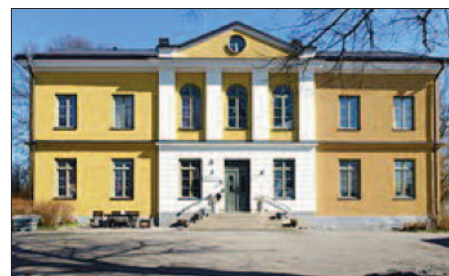
En vacker ny huvudbyggnad uppfördes 1865 på Skarpnäcks säteri