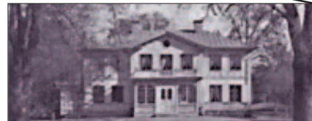
Idag finns bara grunderna kvar till familjen Piehls sommarnöje Ekudden