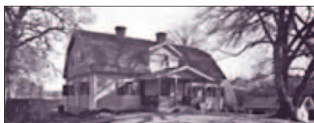
Listudden vid sjön Flaten blev 1886 sommarnöje åt familjen Åkerlund