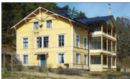
Nacka gård (med arrendatorbostaden ovan) köptes 1888 för 80 000 riksdaler